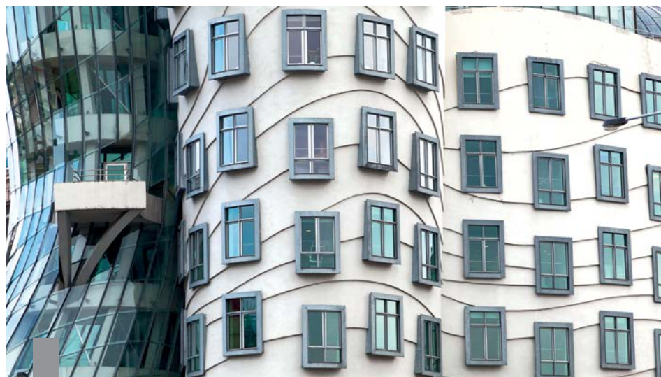
Eine eigene Wohnung macht sich bezahlt. Der Erwerb von Wohneigentum ist im bundesdeutschen Durchschnitt rund 41 Prozent günstiger als Wohnen zur Miete.

Wie groß der Vorteil für Wohneigentümer gegenüber Mietern ist, unterscheidet sich von Stadt zu Stadt. Die Vorteilhaftigkeit von Wohneigentum reicht in den Metropolen von 34 Prozent in München bis zu 47 Prozent in Hamburg. Auf Kreisebene schwankt die Vorteilhaftigkeit zwischen 13 Prozent und 67 Prozent. Der Trendindikator von TNS Infratest zeigt, dass Immobilieninteressenten sich dieser Tatsache durchaus bewusst sind. Wegen der niedrigen Zinsen erscheint Immobilienbesitz derzeit attraktiver denn je. Drei Viertel der Deutschen sehen im „Betongold“ die beste Geldanlage. Gut jeder fünfte Mieter beabsichtigt, in den nächsten zehn Jahren eine Immobilie zu bauen oder zu kaufen, obwohl laut empirica die inserierten Kaufpreise für neue Eigentumswohnungen im vierten Quartal 2016 in den kreisfreien Städten gegenüber dem Vorjahresquartal um 9,9 Prozent und in den Landkreisen um 7,6 Prozent gestiegen sind.